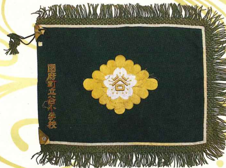
たにしむつこう 谷小学校校旗 所蔵／国府東小学校