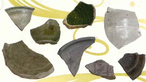
いなほこくちらあし 因幡国庁跡出土遺物 所蔵／鳥取県立博物館