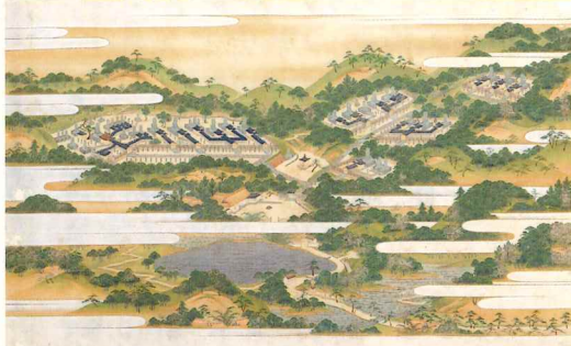
おおぎしたんかい おくだにこひやし 大岸探海画「奥谷御廟所図」 所蔵／鳥取県立博物館