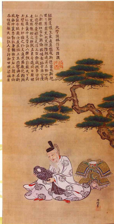
たけのうちすけのみこと 武内宿禰命像